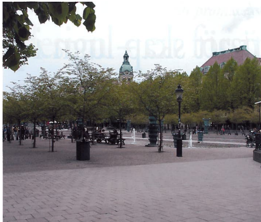
Tanken är att ljuden ska ha någon anknytning till platsen, till exempel kan det passa bra med ljud av porlande vatten på en plats där vatten finns. Vintertid kanske ljudet av skridskor mot isen passar bättre. Men det gäller att vara försiktig med vilka ljud man väljer.

Än så länge har ljuddesign i offentliga miljöer inte fått något brett genomslag i Sverige. Men det pratas betydligt mer om