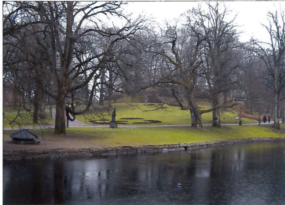
Parkens stillhet och tysthet ger goda förutsättningar för att människan ska klara sin rekreation.

– Vi är bra på att skydda oss från ljud genom bullerplank och annat, men vi är