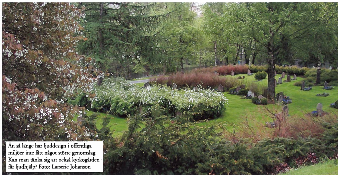
Än så länge har ljudesign i offentliga miljöer inte fått något större genomslag. Kan man tänka sig att också kyrkogården får ljudhjälp?

häft mycket de senaste åren. Fler börjar fundera över vad ljud kan tillföra och mycket kommer att hända framöver. Det här är bara början. Man bör kika på bra referenser, och då är det viktigt att det som görs är av bra kvalitet. Det är inget snack om att det kommer bli mer ljudesign, tekniken är billigare i dag. Med relativt små medel kan en park bli mycket trevligare.