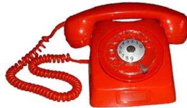
telefon med snurrskiva